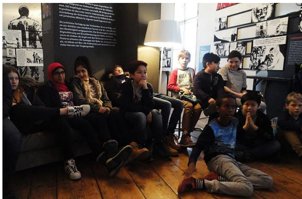
Vortrag im Literaturhaus