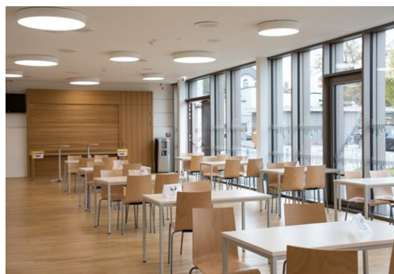
Mittagessen findet im hellen Schulbuffet statt