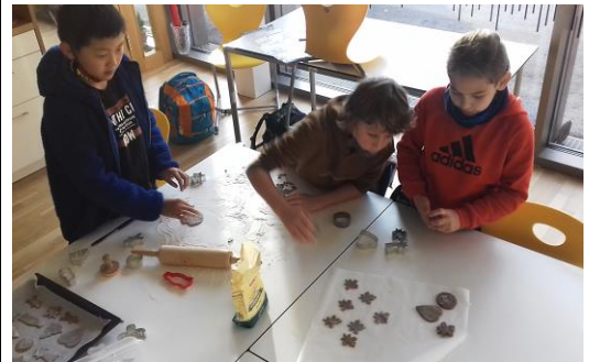
Gestalten von Billets / Kekse backen